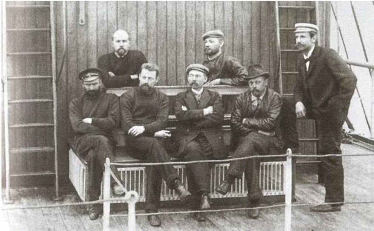
Участники северной экспедиции на «Заре». Крайний слева — А. В. Колчак

В 1895-1899 гг. он нес службу в военном Балтийском и Тихоокеанском флотах. В данный период биографии он смог трижды совершить кругосветное путешествие. За это время ему удалось получить множество полезных навыков и практических знаний, касающихся морского дела. Помимо выполнения непосредственных обязанностей по службе, юноша серьезно интересовался исследованием Тихого океана.