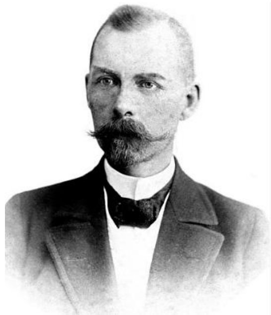
Эдуард Васильевич Толль