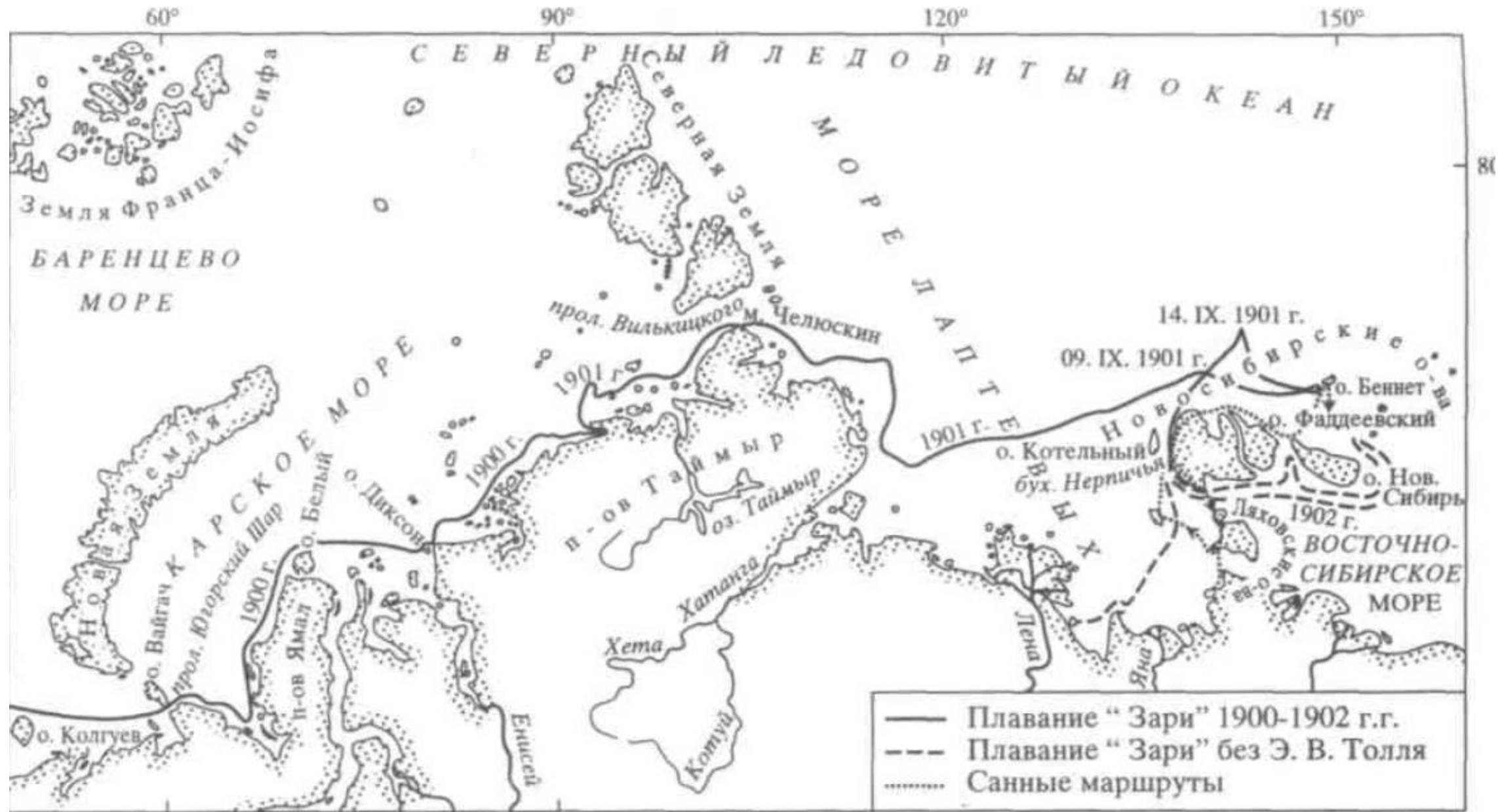
Маршруты Полярной экспедиции 1900–1902 гг.