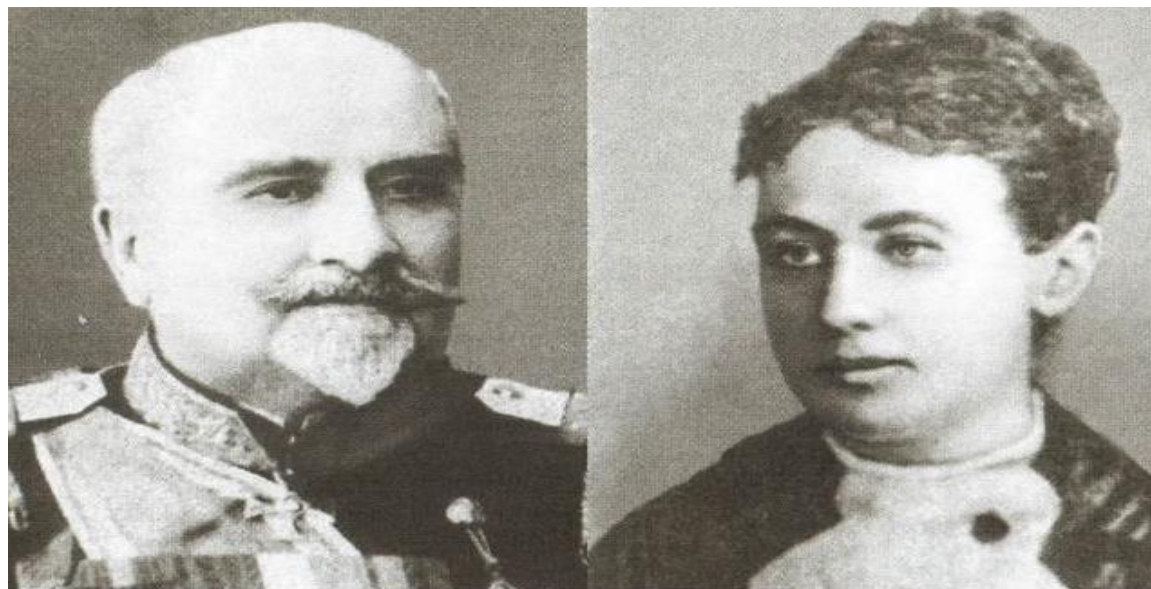
Родители адмирала Колчака

Это решение, в образовательном плане, оказалось верным и в 1894 году Колчак блестяще закончил училище. В списке успеваемости выпуска он занимал скромное первое место.